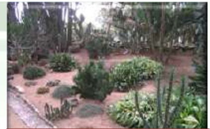
jardín de cactáceas