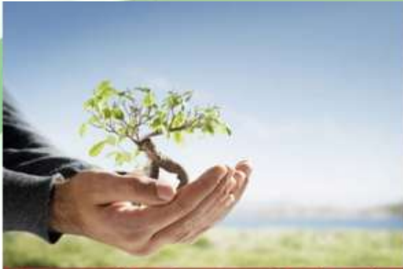
Conservación y Restauración de suelos