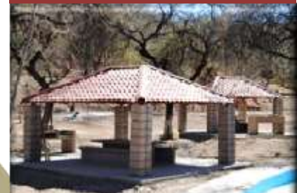
Áreas de convivencia