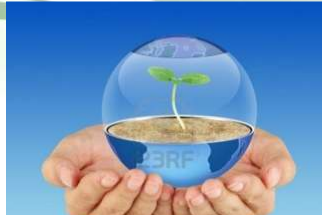
Conservación de terrenos con valor ambiental