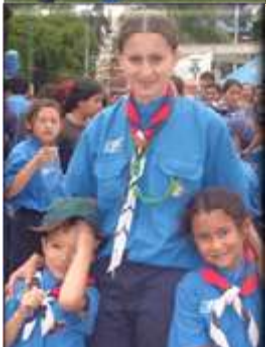
escultismo - campismo