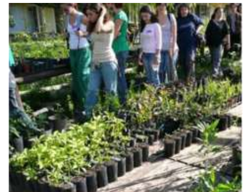
Rescate de plantas nativas